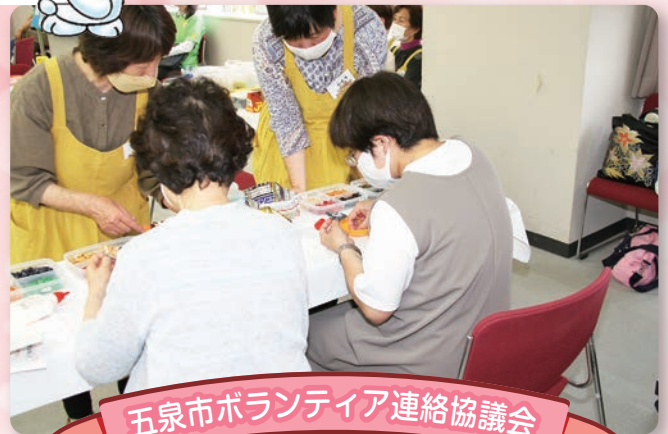
五泉市ボランティア連絡協議会

私たちは地域のすべての方々が安心して暮らすことのできるまちづくりを目指しています。 みなさまからご協力いただく募金は、市内の地域福祉活動を行う福祉団体や、ボランティア団体への助成のほか、新潟県内の障がい者支援施設や高齢者福祉施設、災害時の活動などに役立てられます。