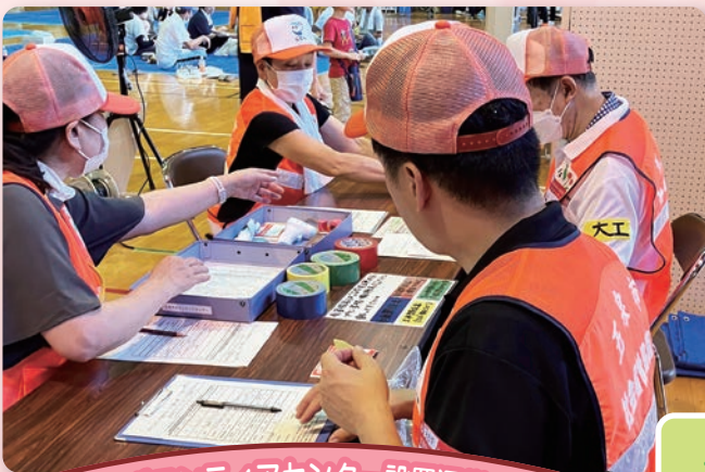
災害ボランティアセンター設置運営訓練