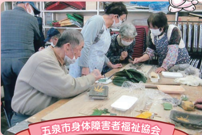
五泉市身体障害者福祉協会